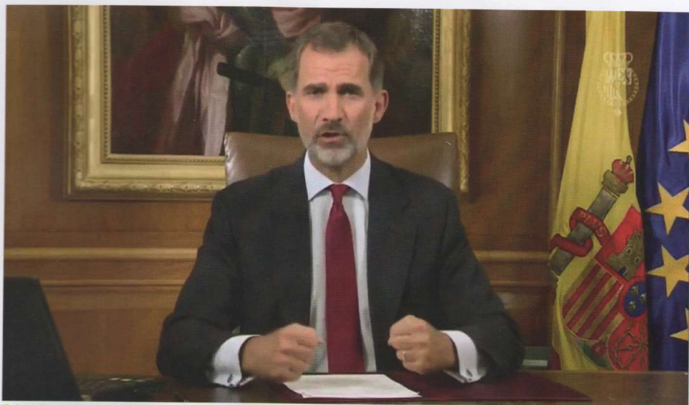
Felip VI, en un missatge emès per televisió el 3 d'octubre, condemnà amb duresa l'actitud dels polítics i els ciutadans catalans. No solament ho expressà de manera verbal, sinó també gestual.

aquella jornada que ja estava en marxa des de divendres al vespre. Una imatge en què un grup de policies, completament uniformats, esberlen un vidre i a puntades de peu entren en un centre de votació on erròniament esperaven la presència de Carles Puigdemont. Una violència més aviat simbòlica que va marcar l'inici d'una violència encara més esfereïdora. L'ampli calidoscopi de seqüències ens retrotrau des de la famosa fotografia de Manel Armengol sobre la repressió franquista (1976) fins a vinyetes d'Albert Uderzo amb nombrosos soldats romans en formació entrant en algun petit llogaret, costat grotesc i irònic també trobat dins el dramatisme d'aquell dia.