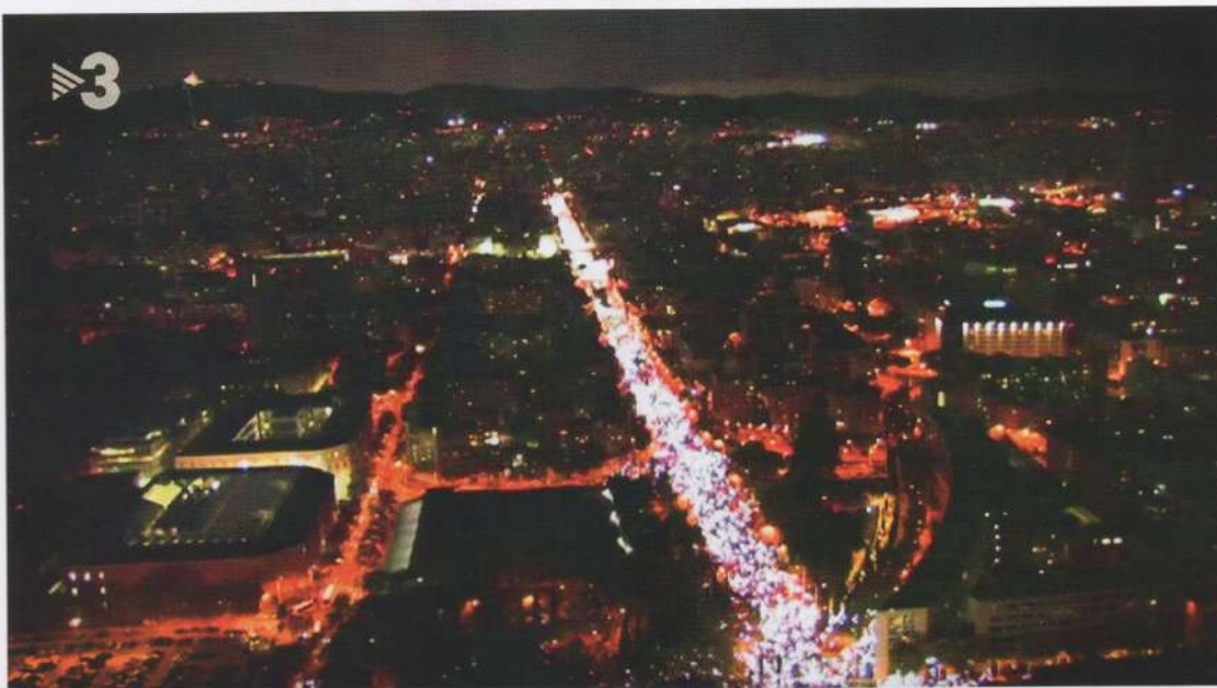
La manifestació de l'11 de novembre per la llibertat dels presos polítics va prendre un caire visualment no habitual. L'acció col·lectiva per il·luminar la trobada amb els llums dels mòbils provocà una imatge sorprenent, un feix de llum enmig de la foscor.

La llista d'altres d'imatges que van marcar aquests mesos és àmplia. Partits polítics abandonant el Parlament i deixant part de l'hemicicle buit; el vaixell rebatejat com a Piolín atracat al port de Barcelona; la seu de la CUP rodejada per la policia i defensada per simpatitzants; la diversitat de manifestacions encadenades (independentistes, unionistes, una a favor del diàleg) i cadascuna amb fets singulars i participants significatius; els conflictes violents al carrer creats per grups d'extrema dreta agredint persones i mitjans de comunicació; la votació per la independència al Parlament i l'aprovació de l'article 155 al Senat amb poques hores de diferència, entre d'altres. Imatges imprevistes, previstes, oficials, amateurs... En els propers temps en sorgiran de noves que aniran il·lustrant el relat fins a arribar a la seva clausura, sigui quina sigui, àlbum iconogràfic d'un temps excepcional.