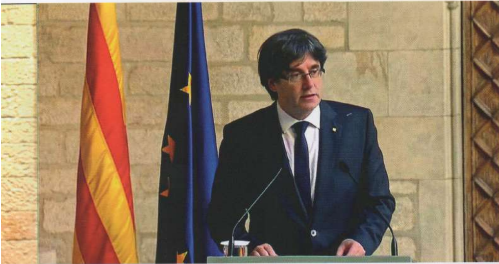
Posada en escena, també, en els tres missatges oficials de Carles Puigdemont posteriors al del rei. La posada en escena juga amb les portes del fons (oberta el 4-10, entreoberta el 21-10 i sense porta el 26-10) i amb la tria de banderes.